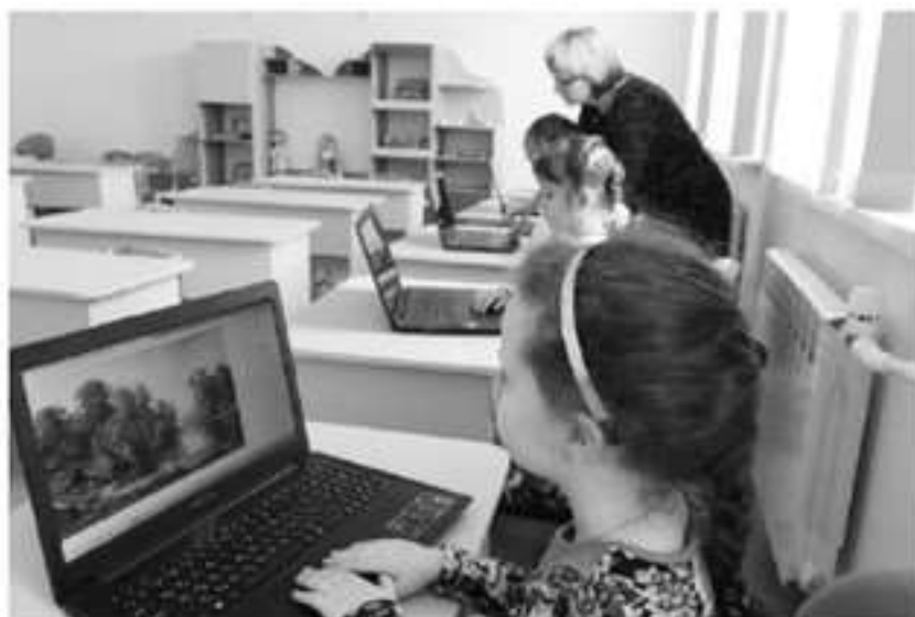
Фото 2. Индивидуальная работа. Дети рассматривают картины с видеозаписи. Темп работы за ноутбуком регулируют сами

Театр. Посетить детский спектакль сегодня не проблема. С помощью информационных технологий можно побывать на представлении в зрительном зале любого театра. Дети с удовольствием наблюдают за действиями актеров на сцене, жестами, мимикой, интонационной выразительностью и силой голоса.