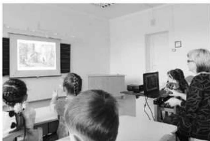
Фото 1. Дети смотрят интерактивную выставку. Педагог контролирует время, комментирует видеоряд

зительного искусства детей познакомит программа «Давайте рисовать!»: tv.ru/shows/kandinsky-vozdryu-ricovat . Ее создали на детском телеканале «О!» совместно с Московским музеем современного искусства, Пушкинским музеем, Музеем современного искусства «Гараж», Третьяковской галереей. Программа «История искусства вместе с Хрюшей и Стелашкой»: kanusel-tv.ru/audience/12043-istoriya_iskusstva_ymeste_s_khryushey_i_stelashkoy . Детей знакомят с мировыми шедеврами живописи, скульптуры, архитектуры, русскими художниками.