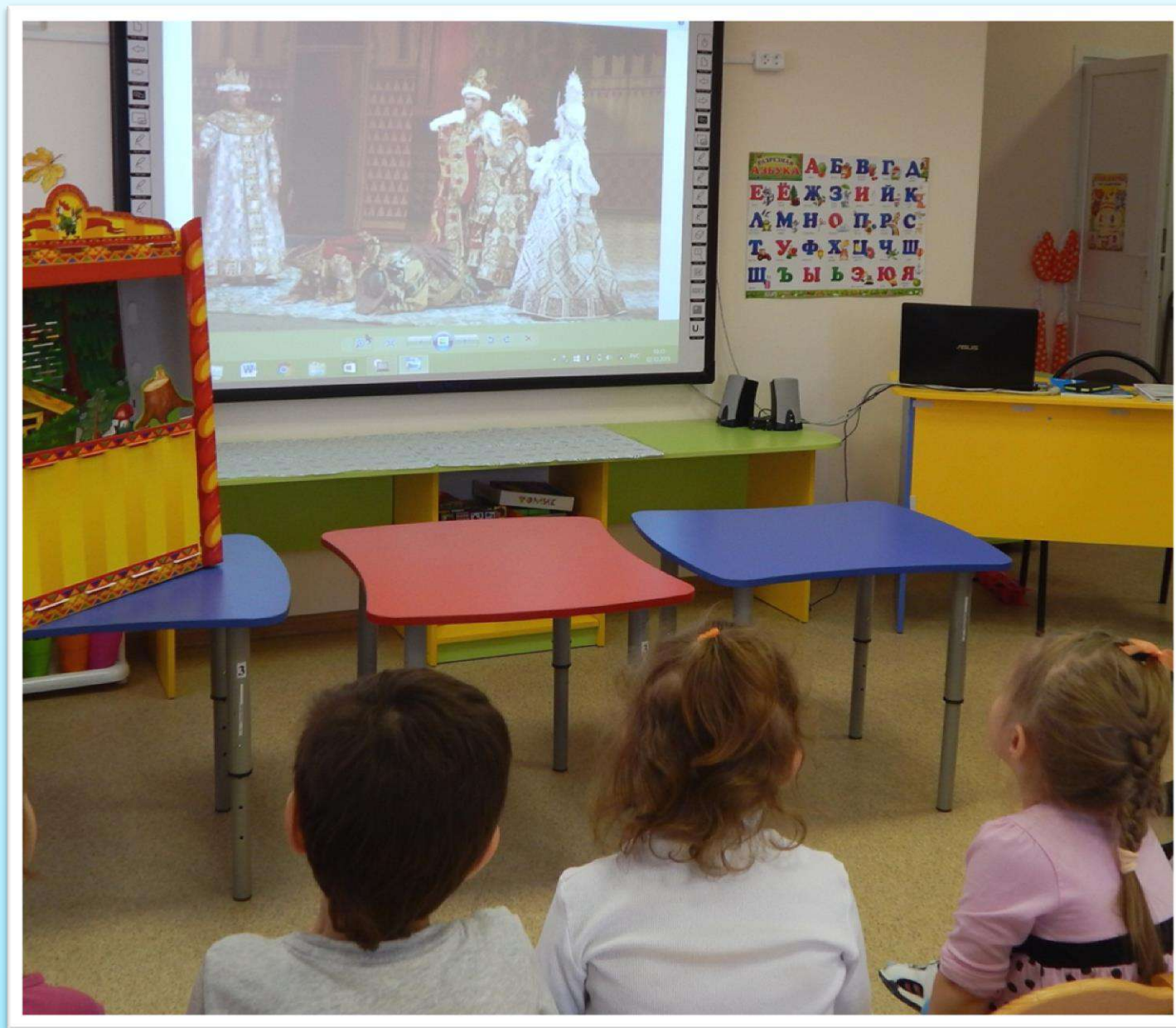
Просмотр спектакля по сказке С. Маршака «12 месяцев».