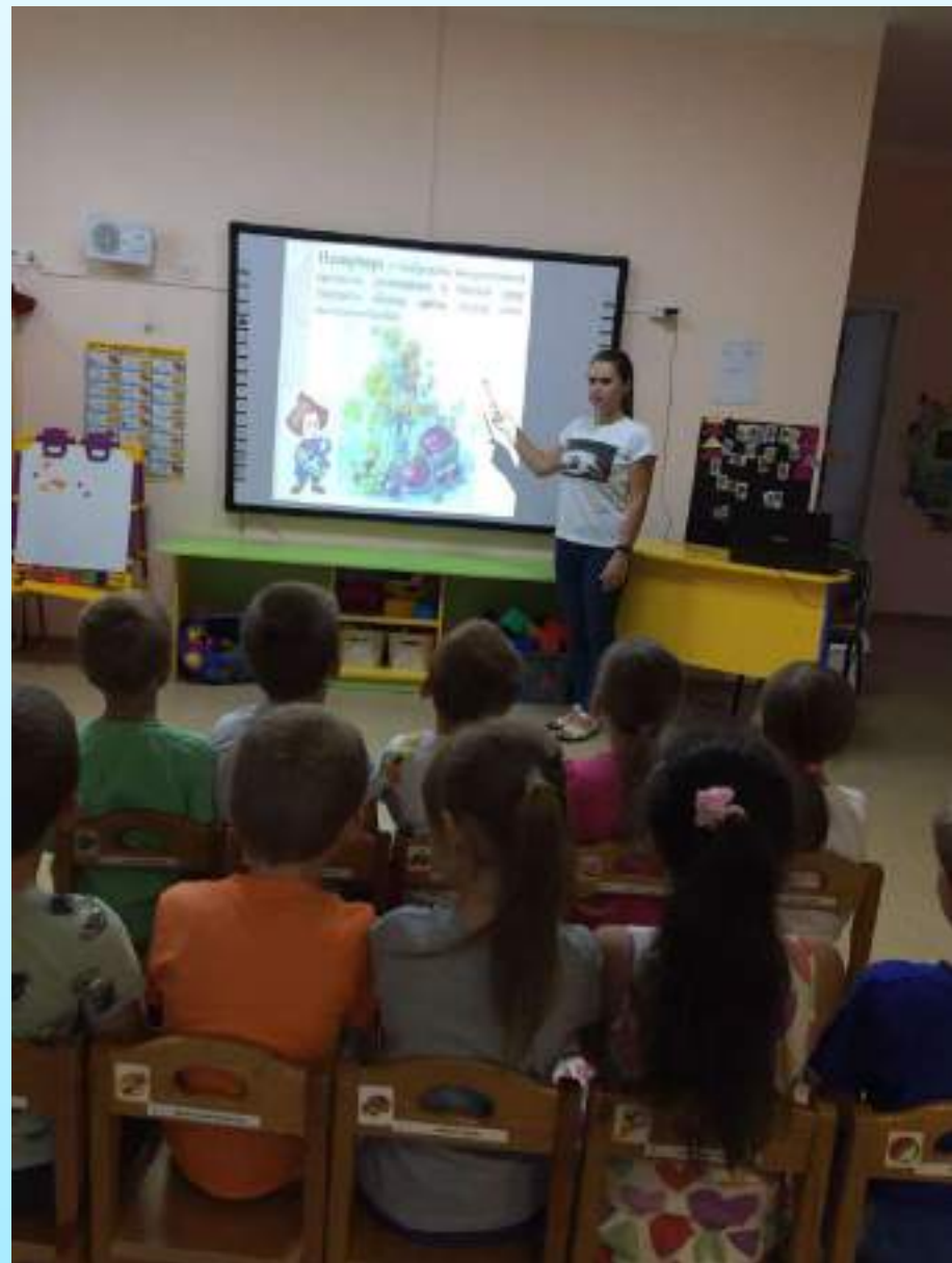
Изучение жанров изобразительного искусства.