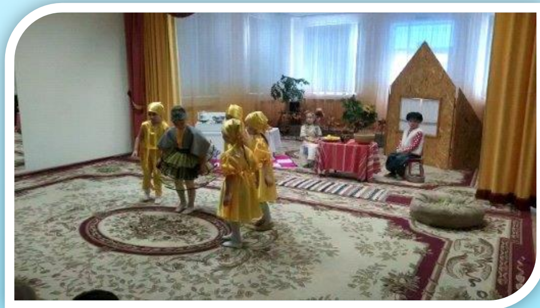
Спектакль «Курочка Ряба».