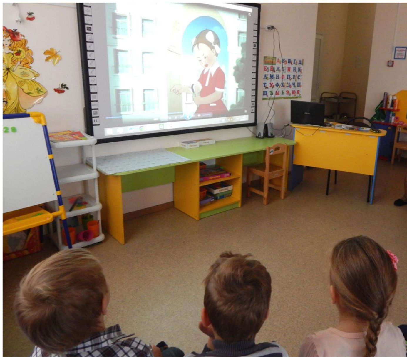
Просмотр мультфильма по прочитанному произведению В.Катаева «Цветик – семицветик».