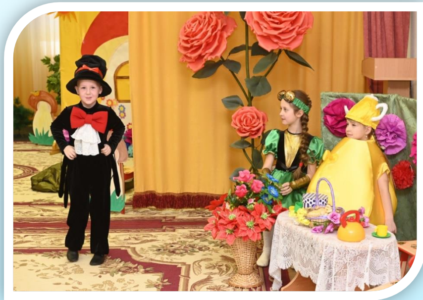
Спектакль «Муха Цокотуха».