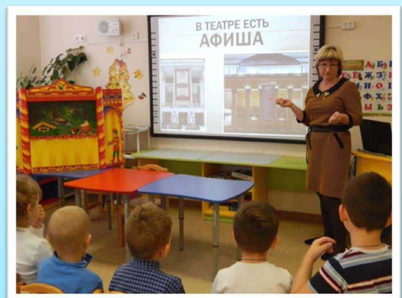
При знакомстве с театром.