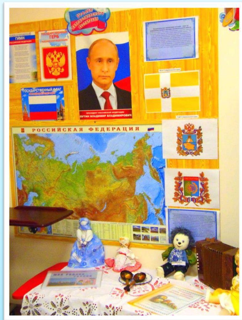
Центры патриотического воспитания.