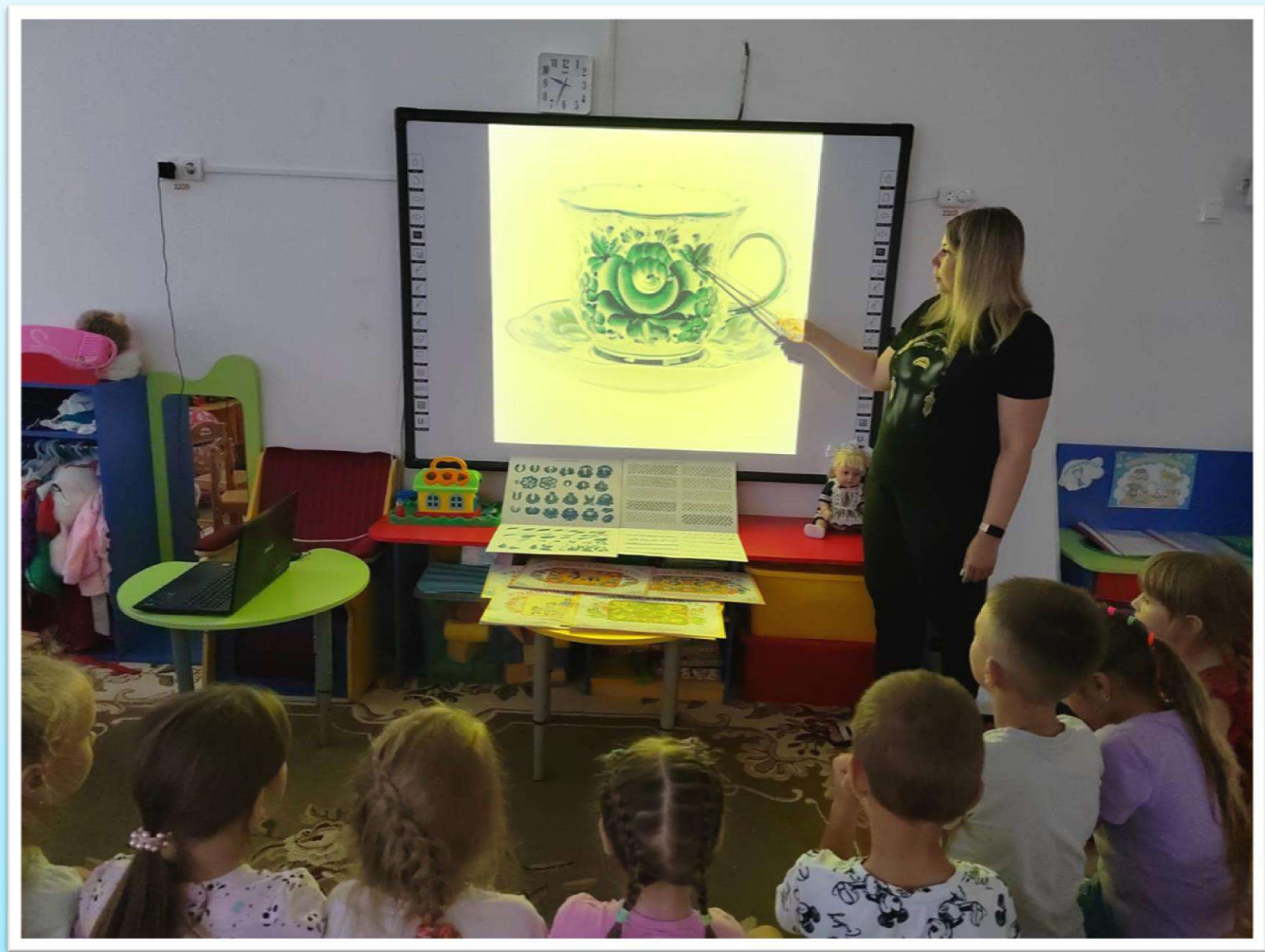
Знакомство с декоративно – прикладным искусством.