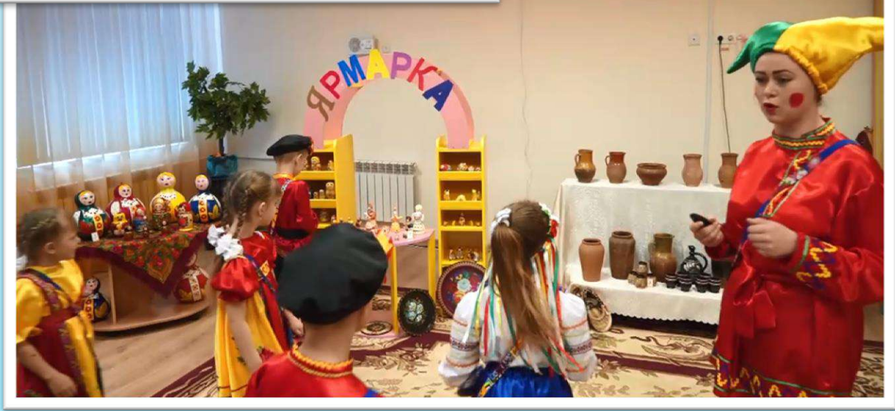
Образовательная деятельность «Ярмарка народных умельцев» в музыкальном зале.