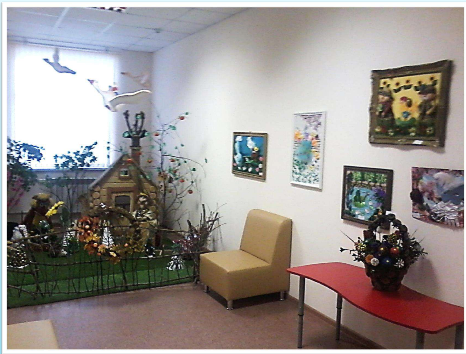
Центр русской народной сказки.