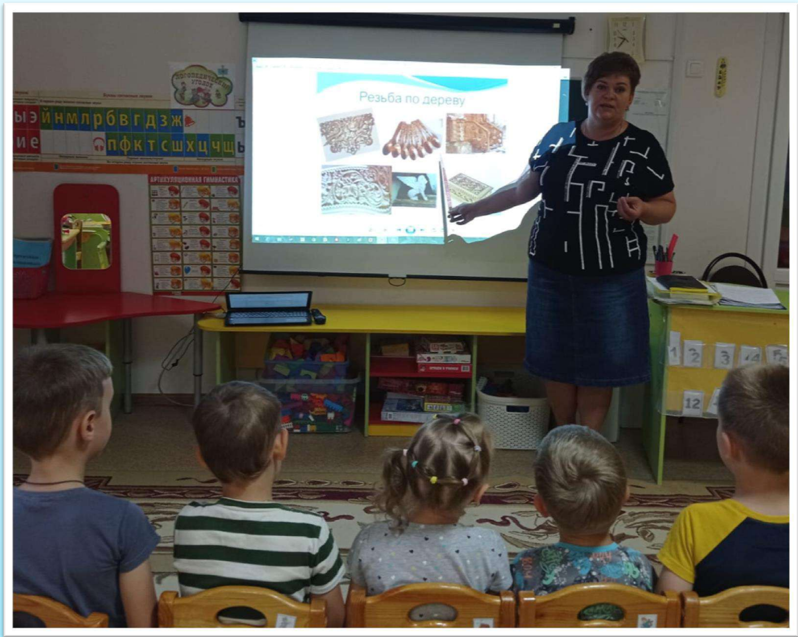
Ознакомление с народными промыслами.